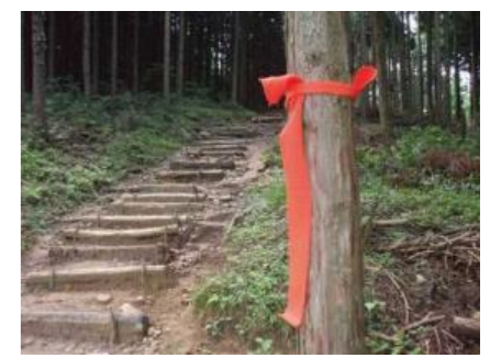
オレンジ色の誘導マーカ 約30~50m間隔

途中棄権の場合も必ずゴール係まで連絡してください。 連絡なき場合、行方不明として山狩り搜索します。